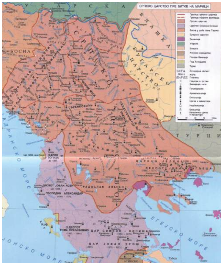
Карта Српског царства пре битке на Марици (Из књиге Милоша Благојевића, Српска државност у средњем веку, Београд 2011.)

и то из православних манастира и цркава, као што су нпр. потковичасти лукови за које је „вјероватно да су они дошли из Србије преко Никшића и Билеће“ 31 , или крст са стаблом и краковима формираним од троструке траке који „вјероватно дугује своје поријекло крсту на сјеверном порталу манастира у Дечанима“. 32 Овим ми не тврдимо да су украси на