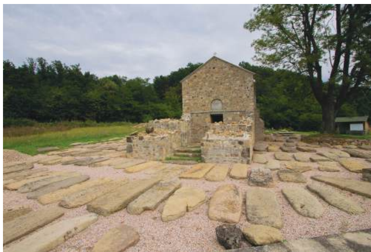
Некропола око цркве у селу Дићи

пред смрт добио монашко име Никола, а умро је у вријеме владавине краља Стефана Дечанског. Као и на многим стећцима, и на споменику челника Влкдрага пише да је он „раб Божији“. Сигурно се зна да је у гробљу око цркве сахрањивање вршено у периоду од XIV–XV вијека, а то знамо по налазима новца српског цара Уроша V (1355–1371) и угарског краља Жигмунда (1387–1437). 26 Можемо претпоставити да је и крајем XIII вијека било сахрањивања у овом гробљу, јер тада је и саграђена црква. Након смрти челника Влкдрага бригу око цркве преузео је властелин Детош. Орнаменти који се налазе на овим споменицима „су узор на коме је настала уметност стећака у 15. и 16. веку“. 27