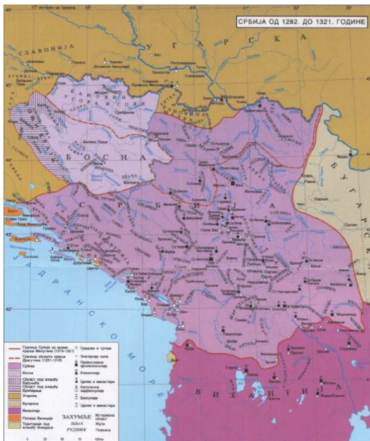
Карта Србије од 1282. до 1321. године (Из књиге Милоша Благојевића, Српска државност у средњем веку , Београд 2011.)

стилу. 7 Претпоставља се да је ту цркву за своју гробницу саградио тепоција „велики српски Мишљен“ у вријеме хумског „јепископа Пекпала Стефана“, а саграђена је унутар некрополе са стећцима. У самој цркви пронађене су три гробне плоче великих димензија које одговарају стећцима у облику плоче. 8