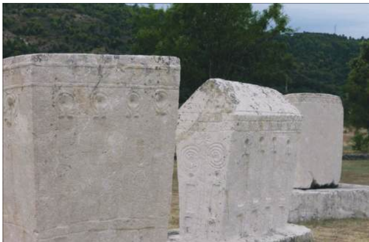
Некропола стећака на Радимљи