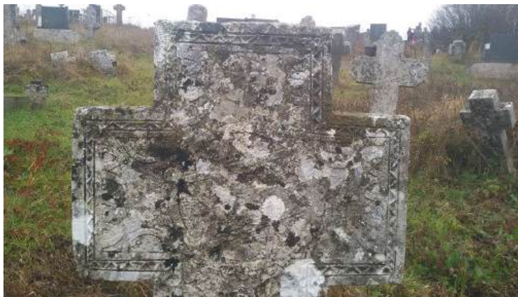
Крстови из XIX-XX вијека у Гламочу