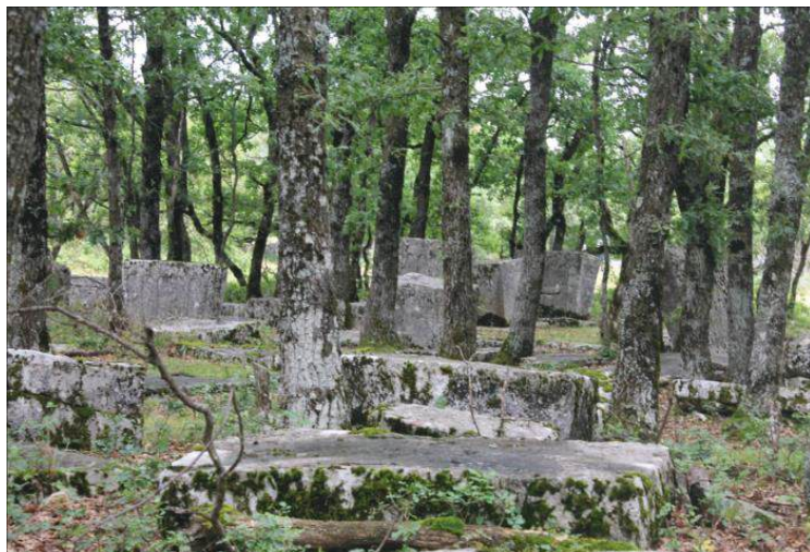
Некропола у селу Баљцима код Билеће